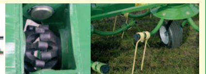
Octolink - 8 prstna Krone sklopka, brez vzdrževanja