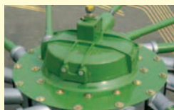
Brez vzdrževanja in trajno namazano!

Poznate prednosti senene linije Krone? Oglejte si jih na www.mehanizacija-miler.si