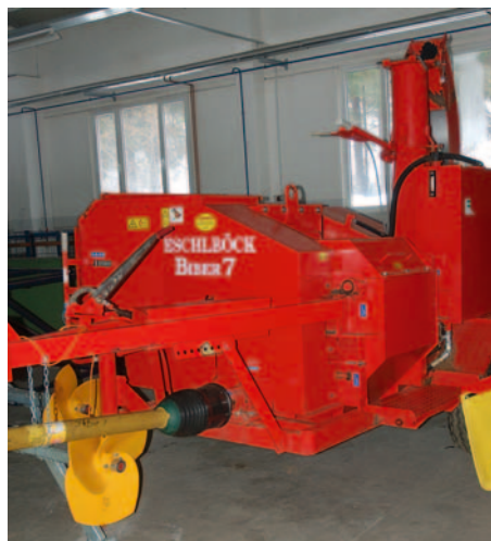
Pri Eschlboeckovih sekalnikih sicer ne pričakujejo velikega števila prodanih strojev, pač pa visok tržni delež.

skokovito narašča: v lanskem letu so obseg prodaje podvojili. Poleg teh dveh nosilnih znamk so v programu podjetja Mehanizacija Miler še ovi-jalke Elho, kosilniki za strme travnike AEBI-Rasant in stroji za pripravo lesne biomase Eschlboeck. Trg za te tri znamke je v Sloveniji nekoliko manjši, se pa zlasti za sekalnike Eschlboeck hitro odpira in kljub majhnemu številu prodanih sekalnikov pri njih dosegajo zelo visok tržni delež.