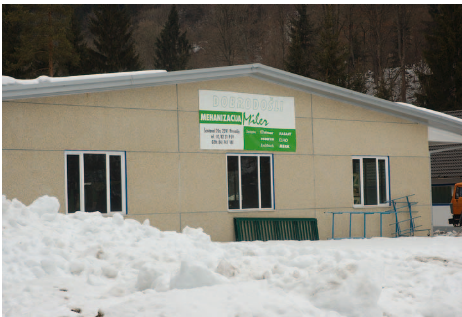
Sredi marca bo odprt nov prodajno servisni center na Prevaljah.